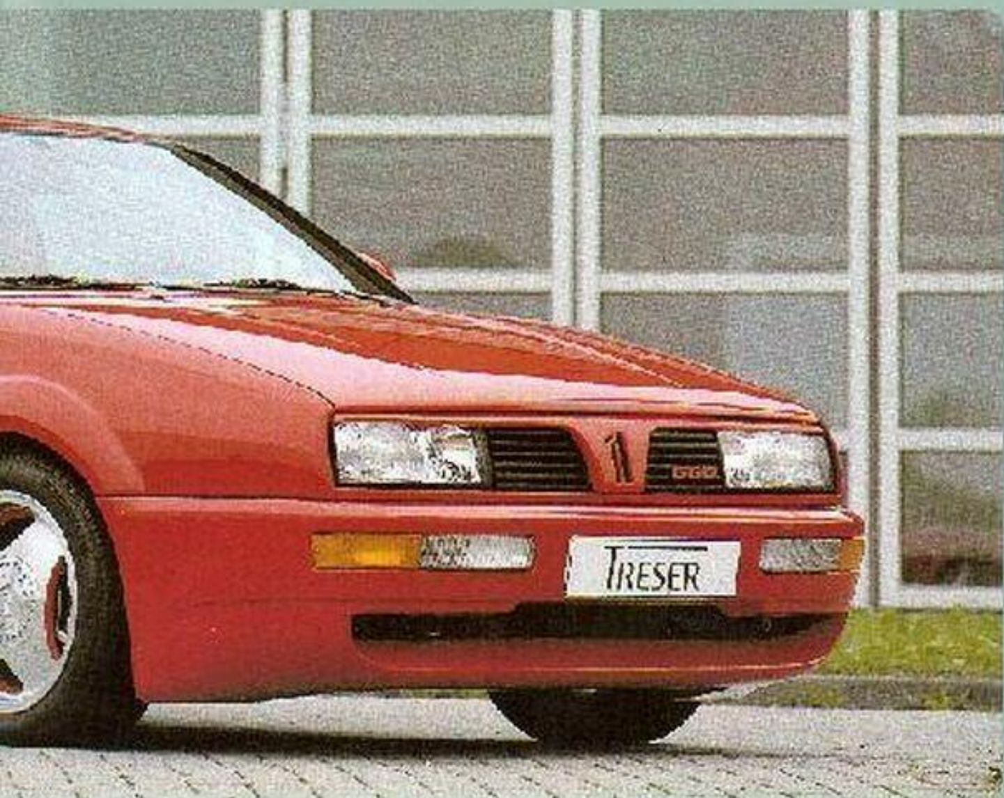
Prisma TRESER 1.6